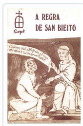
REGRA DE SAN BIEITO VARIOS