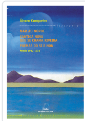
POESIA 1932-1933 (BAC) (MAR O NORDE. CANTIGA NOVA QUE SE CHA) CUNQUEIRO, ALVARO