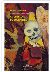
CRONICAS DO SOCHANTRE, AS (BAC) CUNQUEIRO, ALVARO