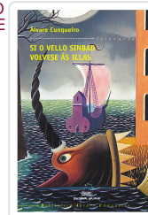
SI O VELLO SINBAD VOLVESE AS ILLAS (BAC) CUNQUEIRO, ALVARO