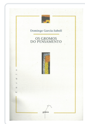
GROMOS DO PENSAMENTO, OS GARCIA-SABELL, DOMINGO