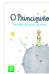
PRINCIPIO, O SAINT-EXUPÉRY, ANTOINE DE