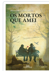
MORTOS QUE AMEI, OS COLLAZO LOPEZ, IRIA