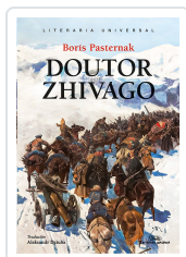
DOCTOR ZHIVAGO PASTERNAK, BORIS