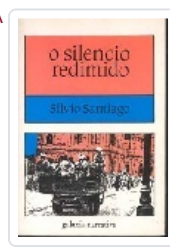
SILENCIO REDIMIDO, O SANTIAGO, SILVIO