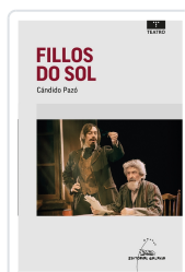
FILLOS DO SOL PAZO, CANDIDO