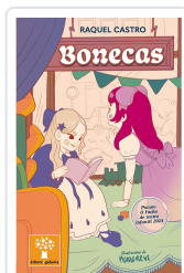
BONECAS (PREMIO O FACHO DE TEATRO INFANTIL 2024) CASTRO, RAQUEL