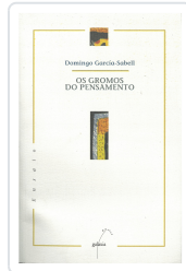
GROMOS DO PENSAMENTO, OS GARCIA-SABELL, DOMINGO