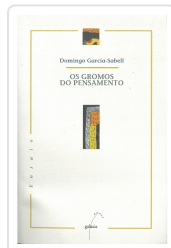
GROMOS DO PENSAMENTO, OS GARCIA-SABELL, DOMINGO