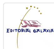
MEMORIAS DUNHA TERRA CASTROVIEJO, XOSE MARIA