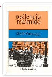
SILENCIO REDIMIDO, O SANTIAGO, SILVIO