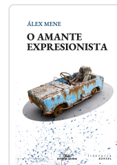
AMANTE EXPRESIONISTA, O MENE, ALEX