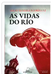
VIDAS DO RIO, AS TEIXEIRA RODRIGUEZ, XULIO