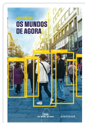
MUNDOS DE AGORA, OS OREIRO, LOIS