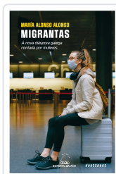
MIGRANTAS. A NOVA DIASPORA GALEGA CONTADA POR MULLERES ALONSO ALONSO, MARIA