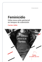
FEMINICIDIO. UNHA NOVA ORDE PATRIARCAL EN TEMPOS DE SUBMISI ADAN VILLAMARIN, CARME