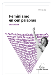
FEMINISMO EN CEN PALABRAS CHAO, LUCA