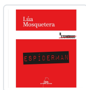
ESPIDERMAN MOSQUETERA, LÚA