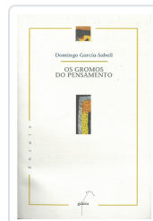
GROMOS DO PENSAMENTO, OS GARCIA-SABELL, DOMINGO