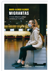
MIGRANTAS. A NOVA DIASPORA GALEGA CONTADA POR MULLERES ALONSO ALONSO, MARIA