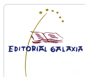
BIBLIA, A (4ª EDICION) VARIOS