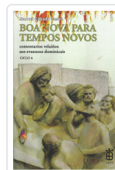
BOA NOVA PARA TEMPOS NOVOS (CICLO A) CABADO CASTRO, MANUEL