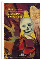
CRONICAS DO SOCHANTRE, AS (BAC) CUNQUEIRO, ALVARO