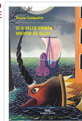
SI O VELLO SINBAD VOLVESE AS ILLAS (BAC) CUNQUEIRO, ALVARO