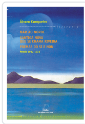
POESIA 1932-1933 (BAC) (MAR O NORDE. CANTIGA NOVA QUE SE CHA) CUNQUEIRO, ALVARO