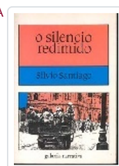
SILENCIO REDIMIDO, O SANTIAGO, SILVIO