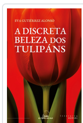
DISCRETA BELEZA DOS TULIPÁNS, A GUTIERREZ ALONSO, EVA