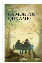
MORTOS QUE AMEI, OS COLLAZO LOPEZ, IRIA