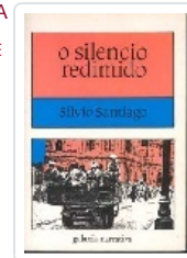
SILENCIO REDIMIDO, O SANTIAGO, SILVIO