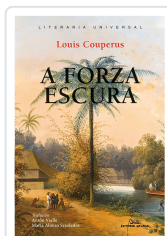
FORZA ESCURA, A COUPERUS, LOUIS