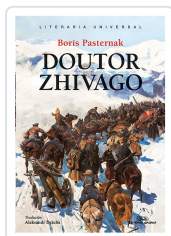
DOUTOR ZHIVAGO PASTERNAK, BORIS