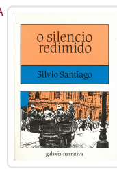
SILENCIO REDIMIDO, O SANTIAGO, SILVIO