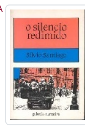
SILENCIO REDIMIDO, O SANTIAGO, SILVIO