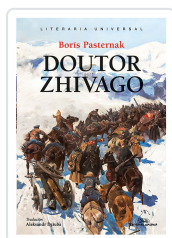
DOCTOR ZHIVAGO PASTERNAK, BORIS