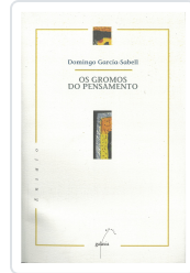
GROMOS DO PENSAMENTO, OS GARCIA-SABELL, DOMINGO