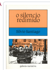
SILENCIO REDIMIDO, O SANTIAGO, SILVIO