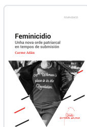
FEMINICIDIO. UNHA NOVA ORDE PATRIARCAL EN TEMPOS DE SUBMISIÓN ADAN VILLAMARIN, CARME