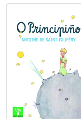
PRINCIPIÑO, O SAINT-EXUPÉRY, ANTOINE DE