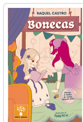
BONECAS (PREMIO O FACHO DE TEATRO INFANTIL 2024) CASTRO, RAQUEL