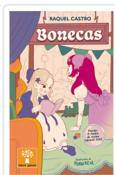
BONECAS (PREMIO O FACHO DE TEATRO INFANTIL 2024) CASTRO, RAQUEL