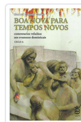
BOA NOVA PARA TEMPOS NOVOS (CICLO A) CABADO CASTRO, MANUEL