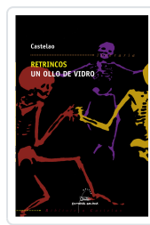
RETRINCOS. UN OLLO DE VIDRO (BC) CASTELAO