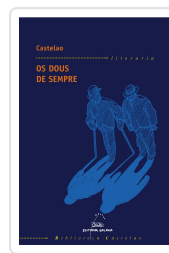
DOUS DE SEMPRE, OS (BC) CASTELAO