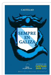
SEMPRE EN GALIZA (BC) CASTELAO