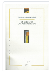
GROMOS DO PENSAMENTO, OS GARCIA-SABELL, DOMINGO