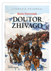
DOUTOR ZHIVAGO PASTERNAK, BORIS