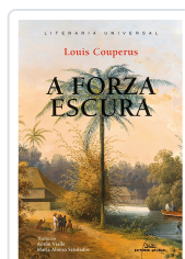
FORZA ESCURA, A COUPERUS, LOUIS