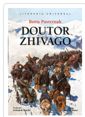
DOUTOR ZHIVAGO PASTERNAK, BORIS