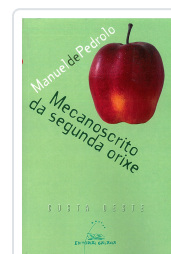
MECANOCRITO DA SEGUNDA ORIXE PEDROLO, MANUEL DE