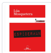
ESPIDERMAN MOSQUETERA, LÚA