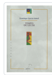
TEMPO DE LECER GARCIA-SABELL, DOMINGO