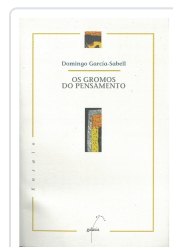
GROMOS DO PENSAMENTO, OS GARCIA-SABELL, DOMINGO