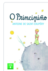
PRINCIPIO, O SAINT-EXUPÉRY, ANTOINE DE