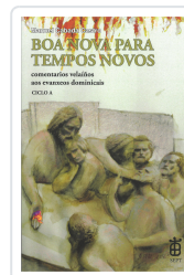
BOA NOVA PARA TEMPOS NOVOS (CICLO A) CABADO CASTRO, MANUEL