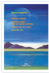
POESIA 1932-1933 (BAC) (MAR O NORDE. CANTIGA NOVA QUE SE CHA) CUNQUEIRO, ALVARO