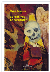
CRONICAS DO SOCHANTRE, AS (BAC) CUNQUEIRO, ALVARO