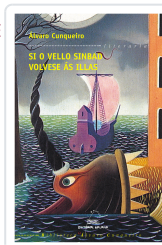
SI O VELLO SINBAD VOLVESE AS ILLAS (BAC) CUNQUEIRO, ALVARO