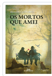
MORTOS QUE AMEI, OS COLLAZO LOPEZ, IRIA