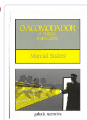
ACOMODADOR E OUTRAS NARRACIONES SUAREZ, MARCIAL