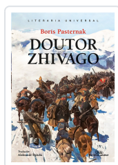
DOUTOR ZHIVAGO PASTERNAK, BORIS