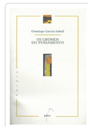
GROMOS DO PENSAMENTO, OS GARCIA-SABELL, DOMINGO