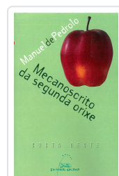
MECANOCRITO DA SEGUNDA ORIXE PEDROLO, MANUEL DE