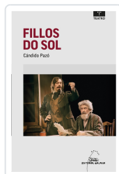
FILLOS DO SOL PAZO, CANDIDO