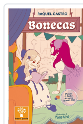
BONECAS (PREMIO O FACHO DE TEATRO INFANTIL 2024) CASTRO, RAQUEL