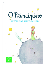
PRINCIPIÑO, O SAINT-EXUPÉRY, ANTOINE DE